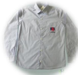
Camisa Social Masculina