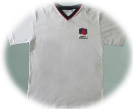
Camiseta Manga Curta ou Manga Longa branca