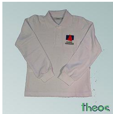
Camisa Polo branca manga curta e comprida