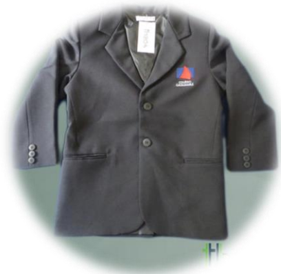
Blazer Oxford Masculino